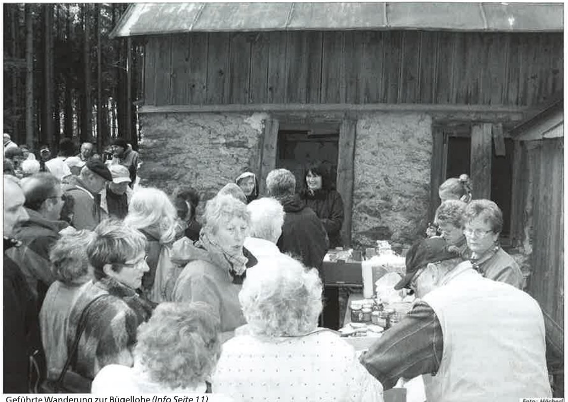
Geführte Wanderung zur Bügellohe (Info Seite 11)

Auch das Gesellige kommt in diesen Tagen nicht zu kurz, denn die Vereine laden zu ihren Veranstaltungen ein und hoffen auf gute Beteiligung bei Musik und allerlei kulinarischen Genüssen. Unser umfangreicher Veranstaltungskalender gibt Ihnen bestimmt zahlreiche Anregungen für einen erlebnisreichen Urlaub.